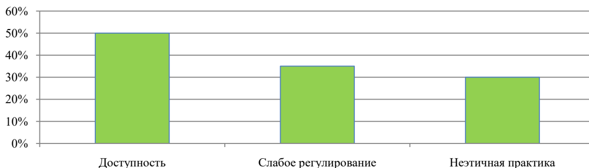
Рис. 3. Причины чрезмерного потребления наркотиков Fig. 3. Reasons for excessive drug use

Несмотря на то, что браузеры DarkNet, зашифрованные приложения и использование «криптовалют» усложняют расследование, органы наркоконтроля отмечают, что им удастся найти уязвимость в криминологических расследованиях: «Мы добились огромного успеха как в выявлении торговых площадок, так администраторов и продавцов в привлечении их к ответственности» 2 .