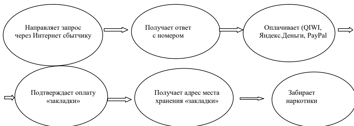
Рис. 2. Схема распространения наркотиков в сети Интернет Fig. 2. Scheme of distribution of drugs on the Internet

Тог предлагает дополнительные уровни конфиденциальности, скрывая IP-адрес пользователя и шифруя информацию. Но сами рынки выглядят как стандартные сайты электронной коммерции, полные фотографий, отзывов клиентов и списков не только наркотиков, таких как кокаин и метамфетамин, но и того, что продавцы утверждают, что это рецептурные препараты известных марок.